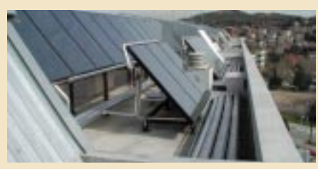
Central tèrmica solar per a l'aigua calenta sanitària (habitatges del carrer Gomis)