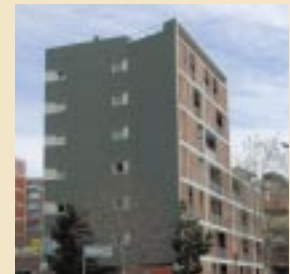
Passeig Vall d'Hebrón