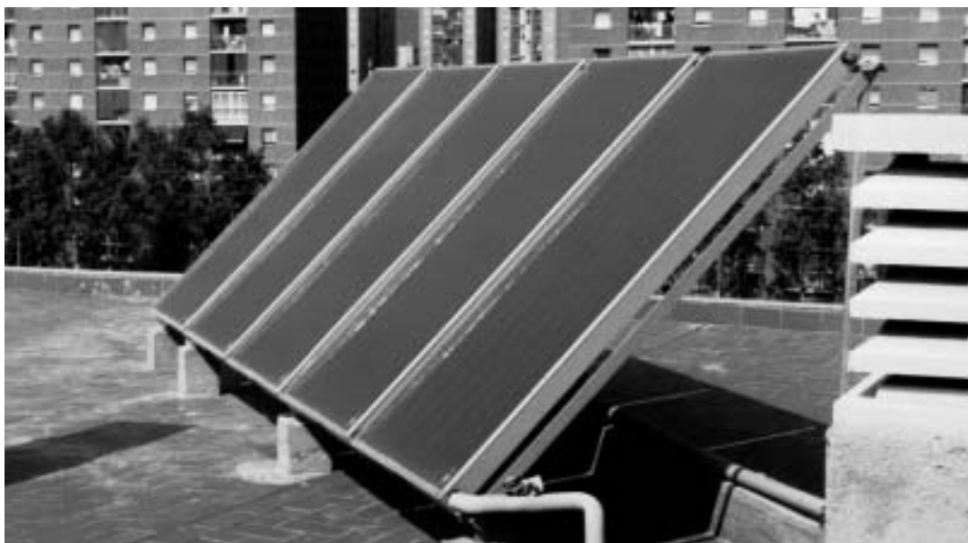
Col·legi Sant Gabriel

2. La competència dels Ajuntaments per imposar sancions, d'acord amb les seves atribucions, correspon als alcaldes, en les quanties següents: als municipis que no tinguin més de deu mil habitants, 100.000 pessetes, en els que no tinguin més de cinquanta mil habitants, 500.000 pessetes, en els que no tinguin més de cent mil habitants, 1.000.000 pessetes, en els que no tinguin més de cinc cents mil habitants, 5.000.000 pessetes i en els que tinguin més de cinc cents mil habitants, 10.000.000 pessetes.