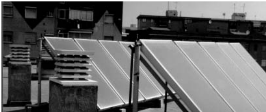
Col·legi Sant Gabriel