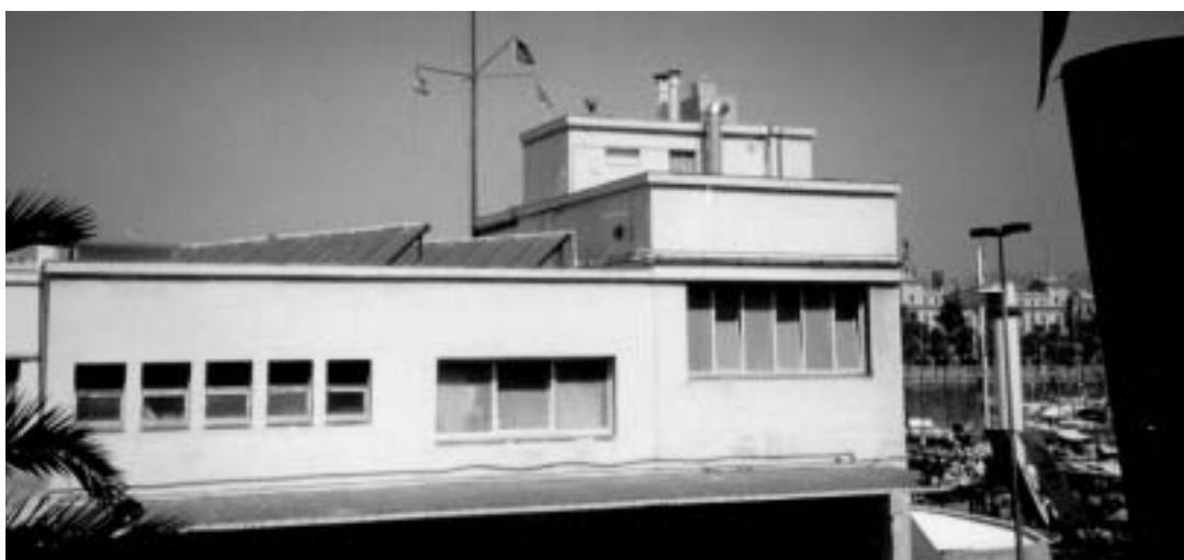
Real Club Marítim – Moll d'Espanya