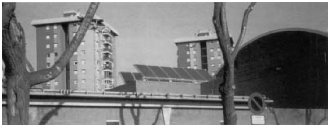
Polisportiu del Bon Pastor

Quan l'ús de l'edifici ho requereixi, (per exemple en establiments hotels amb una ocupació variable al llarg de l'any) es calcularà el consum energètic anual per a la producció d'aigua calenta sanitària i es dividirà aquest valor entre 365 dies per tal d'obtenir el consum mitjà diari i verificar si aquest valor es troba per sobre dels 292 MJ (81 kWh) indicats a l'article 2.