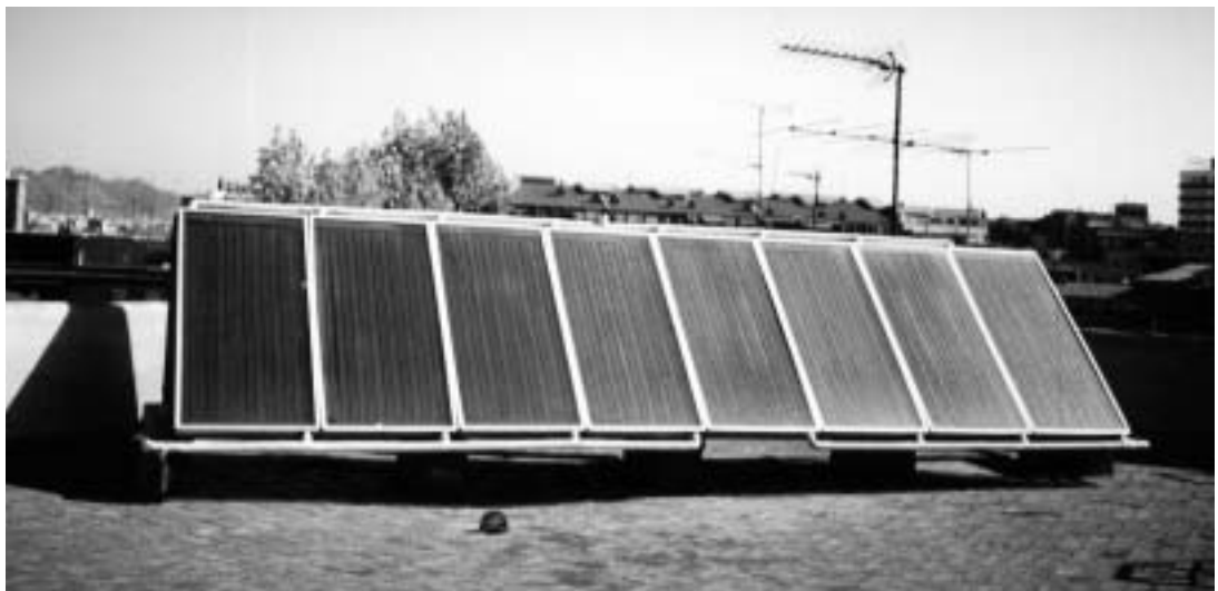
Col·legi La Salle Congrès

3. La situació de suspensió se suspèn quan es garanteixen en la forma que estableix el reglament, el compliment de la normativa que ha motivat la suspensió.